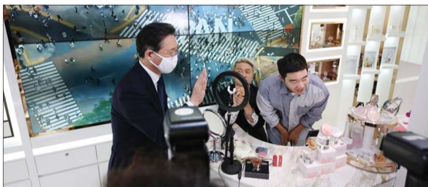
산업부 성윤모 장관이 역직구라이브 방송에 출연해 인사하고있다.

AK몰은 2016년 6월부터 본격적으로 중국 대표 온라인쇼핑몰인 티몰(T.MALL)에 'AK몰' 전용관을 오픈해 국내 백화점 브랜드의 상품을 등록해 판매하는 일반적 인터넷쇼핑몰의 형태로 운영해왔다가, 2019년 10월부터 본격적으로 중국 파트너사인 '카이선'과 협력해 중국인 쇼호스트를 국내에 상주시키고 스튜디오에서 라이브 방송을 진행하는 '언택트' 판매 채널을 적극적으로