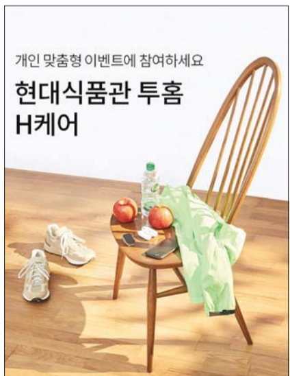
현대식품관 투홈 H케어

또한 일주일에 5일 이상 '7777걸음'을 걸으면 매주 H포인트(500포인트)를