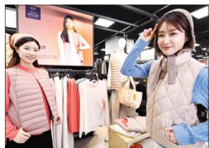
모델들이 15일 서울 등촌동 홈플러스 강서점에서 F2F 겨울 의류를 선보이고 있다.