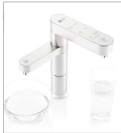
LG전자 퓨리케어 듀얼정수기.

LG전자 퓨리케어 듀얼정수기가 디자인 우수성을 인정받았다. LG전자는 19일 '2020 우수디자인(GD) 상품선정에서 대통령상을 받았다고 밝혔다. 지난해 시그니처 올레드 R에 이어 2년 연속 수상이다. 2020 우수디자인(GD)상품선정은 산업통상자원부가 주최하고 한국디자인진흥원이 주관하는 행사로, 한국디자인진흥원이 공정한 심사를 거쳐 디자인이 우수한 제품과 서비스에 정부인증 마크인 'GD'를 부여한다. 퓨리케어 듀얼 정수기는 빌트인 디자인의 정수기로, 공간 활용도를 높이