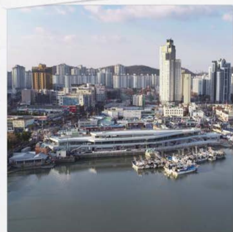
12월 그랜드 OPEN 소래포구 어시장 인천광역시 남동구 장도로 86-17 | 010-9138-7190