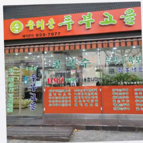
순우리콩만 사용하는 두부 전문점 우리콩 두부고을 서울특별시 동작구 상도로 210 | 02-825-7877