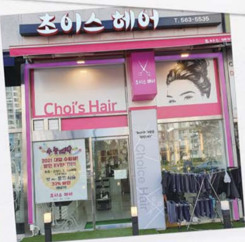
수험생 커트 제외, 모든 시술 30% 할인 초이스 헤어 인천광역시 서구 가정동 607-5, 가정프라자 102호 | 032-563-5535