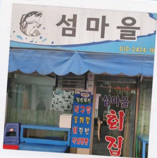
한 번 맛보면 평생 단골 섬마을 서울특별시 동작구 노량진로6길 17 | 02-811-7771