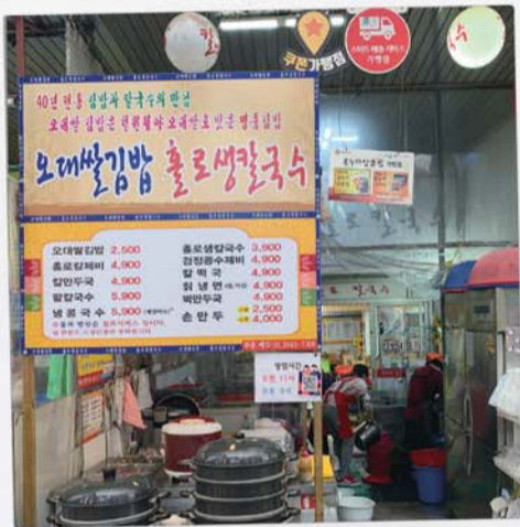
40년 전통 원조 가성비 맛집 오대쌀김밥 홀로생칼국수 서울특별시 양천구 목동중앙남로 46 상가층 103호 | 02-2643-7300