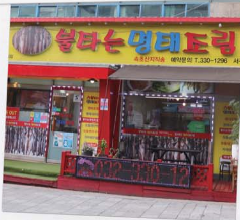
속초 산지직송으로 신선한 생선 요리 불타는명태조림 인천광역시 서구 서곶로315번길 18 1층 | 032-330-1206