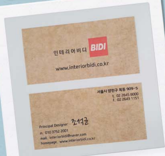
고정관념을 벗어난 창조적 실내디자인 인테리어비디 서울특별시 양천구 목동동로 45 화성프라자 10층 | 02-2645-8000