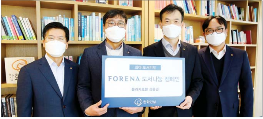
한화건설, 2020 포레나 도서기부 캠페인 시상식 한화건설은 지난 18일 서울 장교동 한화빌딩에서 '2020 포레나 도서기부 캠페인'에 대한 시상식을 개최했다. 지난해에는 일반인 및 임직원이 3500여권의 도서를 기부했으며, 한화건설이 개관한 91개 포레나 도서관에 전달될 예정이다.