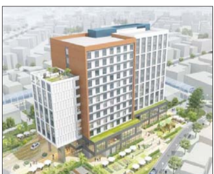
구로구 가리봉시장 내에 들어서는 복합건물 조감도.

해당 건물의 지상 3~12층에는 청년들을 위한 '행복주택' 246호가 마련된다. 지하 1~3층에는 가리봉시장 상인과 주민들이 오랫동안 필요로 했던 공영주차장(186면)이 만들어진다. 지상 저층부에는 시장 고객지원센터, 육아종합지