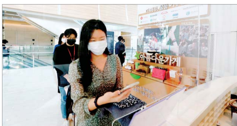
더 마루 프로젝트에 물품을 기부하는 모습.

우선 비대면 방식의 새로운 사회공헌 프로젝트 '더 마루'를 기획했다. 더 마루는 높은 하늘에서 일하는 사람들이 모여 좋은 일을 더한다'는 의미를 담았으며, 롯데월드타워가