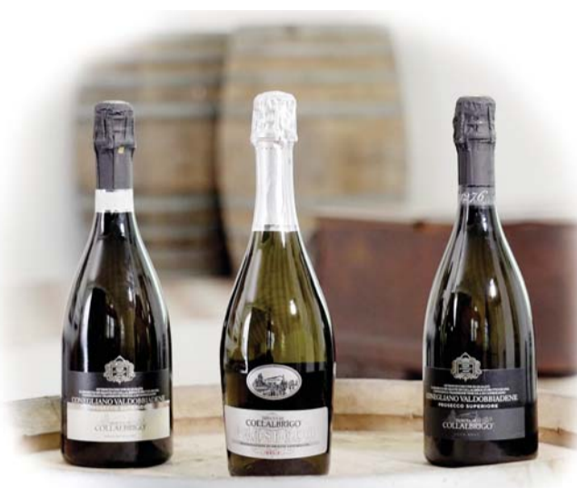
(왼쪽부터)콜라브리고 프로세코 DOCG 엑스트라 드라이, 콜라브리고 프로세코 DOC 브뤼, 콜라브리고 프로세코 DOCG 브뤼. /나라셀라

스�파클링 와인은 2번의 발효를 통해 거품을 만들어낸다. 프로세코는 2차 발효가 샴페인과 같이 병 속이 아니라 대형 스테인리스 탱크 등에