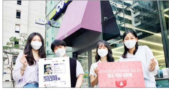
BGF리테일, Z세대 시선으로 실종아동 찾기

다다엠앤씨(DADA M&C)의 친환경 캠페인 라이프스타일 브랜드 "다더더(DEAR DEAR)"가 세계 환경의 날(6월 5일)을 맞아 언택트 플로깅 챌린지에 참여한다. 다다엠앤씨는 CJ온스타일이 설립한 미디어커머스 전문 자회사다.