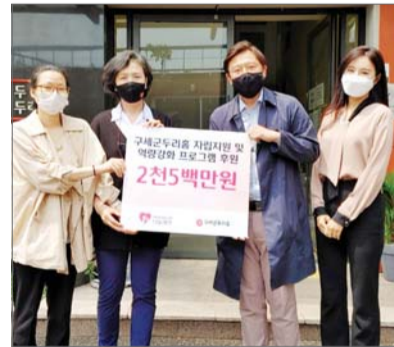
현대중공업그룹1%나눔재단이 서울 서대문구에 위치한 미혼모 복지시설 구세군두리홈을 찾아 후원금을 전달했다. 고 자녀 양육도 지원할 예정이다.

원센터 3곳은 후원 받은 기금을 활용해 발달지연 문제와 정서적 어려움을 겪는 다문화 가정 자녀들을 대상으로 교육 및 치료 프로그램을 운영하고 검정고시 등 결혼이민자들의 학력 취득을 지원해 취업기회를 확대하겠다는 계획이다. 또 구세군두리홈과 미혼모자공동생활가정 안단체는 미혼모들의 경제적인 자립을 돕기 위해 자격증 취득 등 취업역량 강화 교육을 제공하