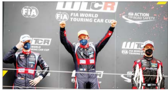
현대차, 고성능 브랜드 'N' 뛰어난 성능 입증

LG화학이 청소년들에게 교육 콘텐츠를 통한 지속가능한 환경의 중요성 알리기에 나선다. LG화학은 7일 기아대책 및 환경부 산하 국가환경교육센터와 손잡고 전국 초·중·고등학교 등에 환경 교육을 지원하는 '그린 클래스' 프로그램을 실시한다고 밝혔다. LG화학 'Like Green' 대학생 멘토단이 청소년 대상 온라인 환경교육을 진행하고 있다.