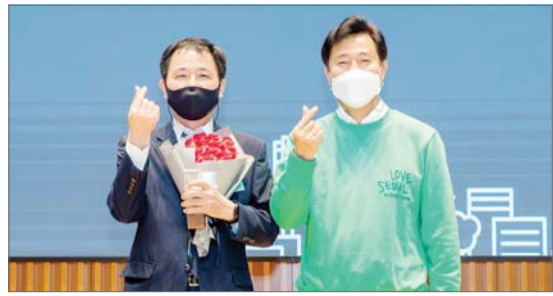
효성티앤씨, 서울시 환경상 '대상' 수상

효성티앤씨는 7일 서울특별시 환경상이 올해 25회째로 당사가 총 21개의 단체 및 개인 중 가장 높은 대상을 받았다고 밝혔다. 효성티앤씨는 이번 수상으로 서울특별시 환경보호에 기여한 공로를 인정받았다. 지난 4일 서울시청에서 김용섭 효성티앤씨 대표이사(왼쪽)와 '리젠서울'이 적용된 플리츠마마의 러브서울 에디션 상의를 입고 있는 오세훈 서울시장(오른쪽)이 기념사진을 찍고 있다.