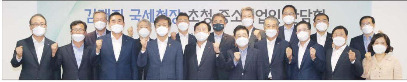
중소기업중앙회는 15일 서울 여의도에서 김대지 국세청장 초청 중소기업인 간담회를 열었다. (앞줄 왼쪽 4번째부터) 김대지 청장, 김기문 중기중앙회장 등 참석자들이 기념촬영을 하고 있다.

김대지 국세청장 초청 간담회 개최 신남방국가 세정지원 강화 등 건의 “유예 대상 확대, 현장조사 축소”