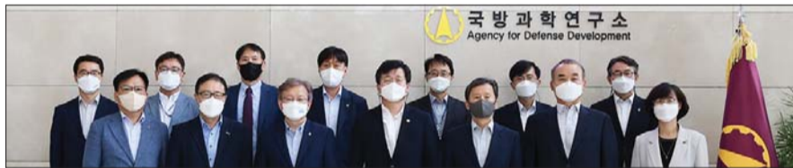
15일 대전 국방과학연구소에서 열린 ‘국방 기술을 활용한 중소기업의 기술혁신과 창업 지원하기 위한 업무협약식’에서 권철승 중소벤처기업부 장관(왼쪽 3번째)이 참석자들과 기념촬영을 하고 있다.

중소벤처기업 관련 공공기관들이 중소기업들을 위해 국방특허기술 사업화 지원에 나선다.