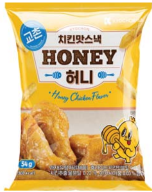
교촌치킨의 감자스틱 제품인 '치킨맛스틱 2종' 이미지.

이에 외식 프랜차이즈로는 첫 유가증권시장에 직상장하며 700억원 가량의 실탄을 장악한 교촌에프엔비는 올해를 교촌이 글로벌 종합식품기업으로 도약하는 해로 삼고 가정간편식, 수제맥주