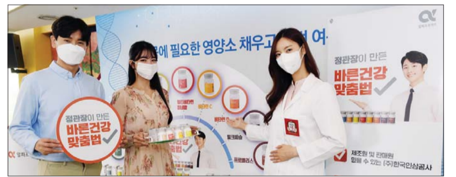
KGC인삼공사가 14일 서울 중구 충무로 한국의 집에서 정관장 알파프로젝트 스탠다드라인 9종을 출시하면서 '내 몸에 필요한 영양소 채우고 이번 여름도 건강하게!' 캠페인을 알리고 있다.