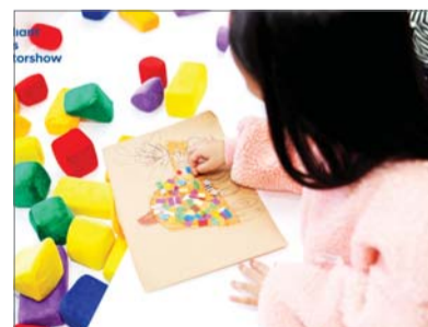
현대자동차 ‘제6회 브릴리언트 키즈 모터쇼’ 이미지

유치부와 초등부(저학년·고학년)로 나눠 진행되며 참가를 희망하는 어린이는 8월31일까지 키즈 모터쇼 홈페이지를 통해 제출하면 된다.