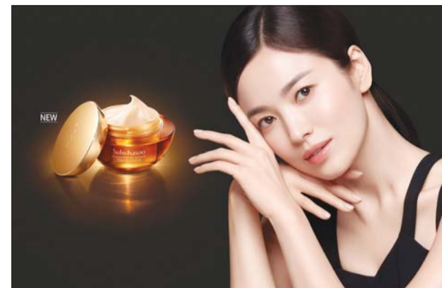
설화수 '자음생크림' 광고모델 송혜교 이미지.

새롭게 출시한 'New 자음생크림'은 선호하는 향과 사용감에 따라 '소프트'와 '클래식'으로 선택할 수 있다. '소