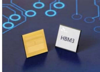
SK하이닉스 HBM3 D램

D램 가격이 결국 하락세로 돌아섰다. '다운 사이클'이 시작했다는 분위기, 다만 국내 반도체 업계 실적 하락은 최소 수준에서 머무를 것으로 예상된다.