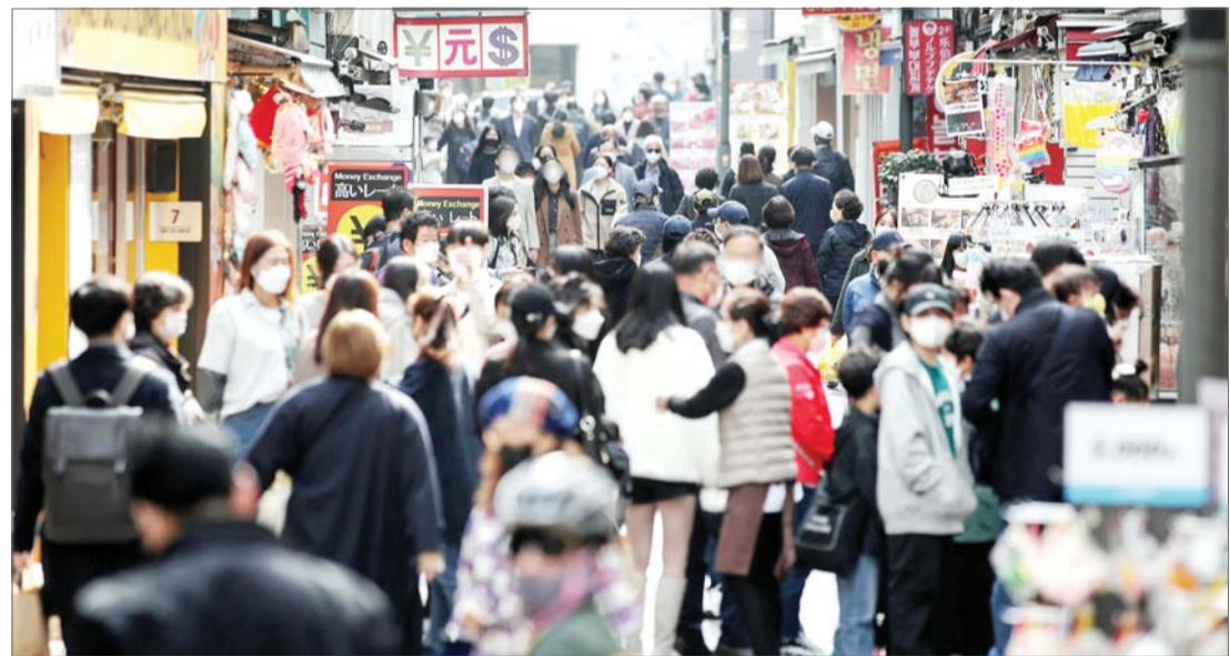
'위드 코로나'(단계적 일상회복)로의 방역체계 전환을 하루 앞둔 31일 오후 서울 중구 명동 거리가 시민들로 북적이고 있다.

다만, 감염 고위험시설인 유흥시설, 콜라텍, 무도장 등은 밤 12시까지 영업을 제한한다. 새벽 영업도 가능해지지만 정부는 31일 헬러데이 파티가 1일 새벽으로 이어지는 것을 막기 위