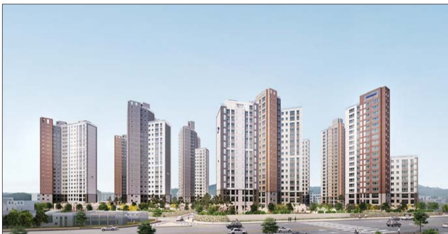
두산위브더 센트럴 투시도

두산건설 '창원 두산위브 더센트럴' 9개 동, 663가구 중 461가구 일반분양