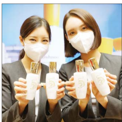
설화수 매장에서 직원들이 호랑이 윤조 에센스를 소개하고 있다.

롯데백화점이 7일부터 9일까지 20여 개 유명 화장품 브랜드가 참여하는 '럭셔리 뷰티 페어'를 진행한다고 밝혔다.