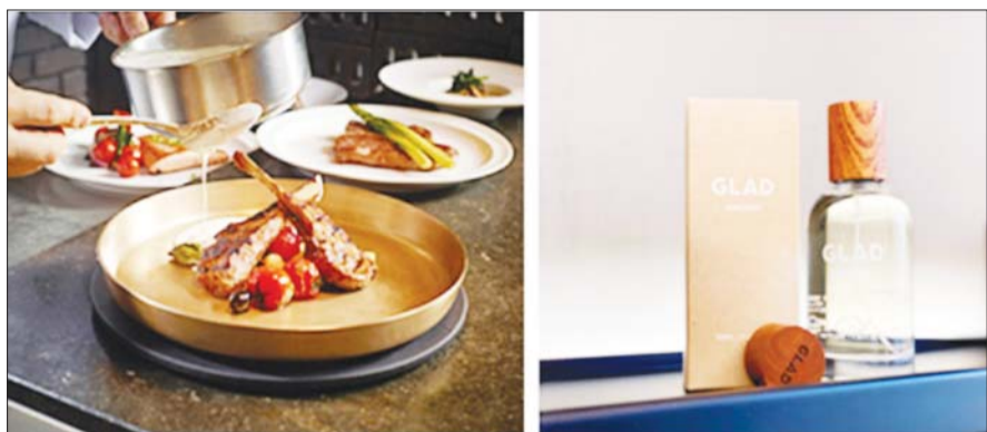
글래드 호텔이 HMR, 홈 인테리어와 같이 카테고리를 다양화해 내놓은 '2022 설 선물세트'. /글래드 호텔앤리조트

롯데호텔 포인트 적립혜택 강화 지역 특산품으로 선물세트 구성 셰라톤 그랜드 인천 호텔 멤버십 회원에 PT 2회 무료 글래드 호텔 가정간편식 선보여 '호텔 로비향' 디퓨저 선물 마련