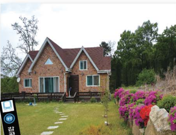
※ 원형지 분할가능 330~990㎡

※ 판교 장호원간 전용도로 개통 목화전원마을에서는 경기도 이천시 장호원 어서리에 전원주택타운을 조성하여 분양을 마치고 회사보유분 전원주택지를 시세의 절반 가격에 선착순 2필지를 분양하고 있다.