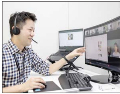
SSAFY 교육 모습

이번 입학식은 코로나19를 고려해 온라인과 오프라인으로 병행됐다. 입학생 50명과 삼성전자 경영지원실 박학규 사장을 비롯해 고용노동부 박화진 차관, 더불어민주당이