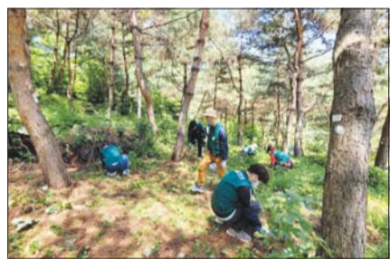
생태계 교란 식물 제거 모습.

해당 기간 한강 밤섬, 암사생태공 원, 월드컵공원, 안양천, 양재천 등 주 요 대상지 총 59개소에서 자체 관리인