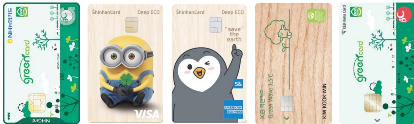
NH농협카드 '올바른지구카드'(왼쪽부터), 신한카드 '신한카드 딥 에코' 2개, KB국민카드 'KB국민 EVO 티타늄 카드', 비씨카드 'BC그린카드' / 각사

농협카드 '올바른지구카드' 출시 버스·지하철·택시 이용시 혜택 신한카드 '딥 에코' 주력 내세워 전기차 충전요금 5% 캐시백 제공 국민카드 'EVO 티타늄 카드' 탄소배출량 줄인 '에코젠시스' 사용 비씨카드 'BC그린카드' 출시 친환경세제 리필·구매 포인트 5배