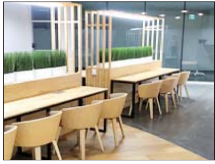
서울에 거주하는 청년들에게 활력소가 될 ‘청년활력소’가 20일부터 서울 중구 서울시청 지하 1층에서 운영을 시작한다. 사진은 청년 활력소 스테디카페. /서울시청

시청 지하 위치... 상담센터 등 운영 만 39세 이하 누구나 무료 이용 “다양한 지원 정책으로 청년 동행”