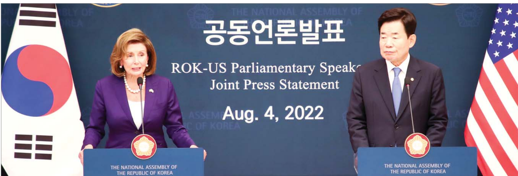
김진표 국회의장과 낸시 펠로시 미국 하원의장이 4일 서울 여의도 국회에서 공동언론 발표를 통해 회담 결과를 발표하고 있다.