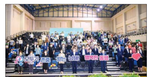
남해군이 양성평등주간 기념행사를 개최했다.