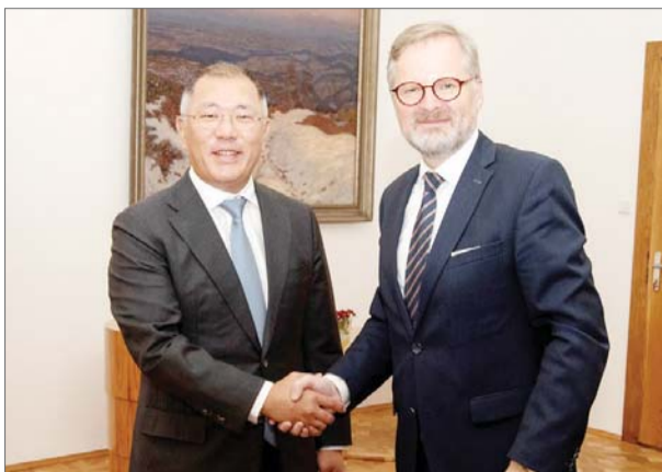
지난달 27일(현지 시간) 체코 프라하 총리실에서 정의선 현대차그룹 회장(왼쪽)이 페트르 피알라 체코 총리를 만나 상호 협력방안에 대해 논의한 뒤 기념촬영을 하고 있다.

26일에는 바하마 나소 총리실에서 필립 데이비스 총리와 알프레드 마이클 시어스 공공사무부장관, 로다 잭슨 외교부 국장 등 바하마 정부 고위급 인사들과 면담하고 세계박람회 후보지로서 부산의 적합성을 알렸다.