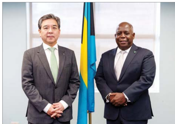
지난달 26일(현지 시간) 바하마 나소 총리실에서 장재훈 현대차 사장(왼쪽)이 필립 데이비스 총리를 만나 부산세계박람회 유치 지원 관련 논의를 한 뒤 기념사진을 촬영하고 있다.

다음날 칠레 산티아고의 경제부 청사를 방문해 살바도레 디 조반니 칠레 투자진흥청 유치본부장과 카를라 플로레스 투자진흥청 전무이사 등을 만나 부산 유치 활동을 이어 갔다.