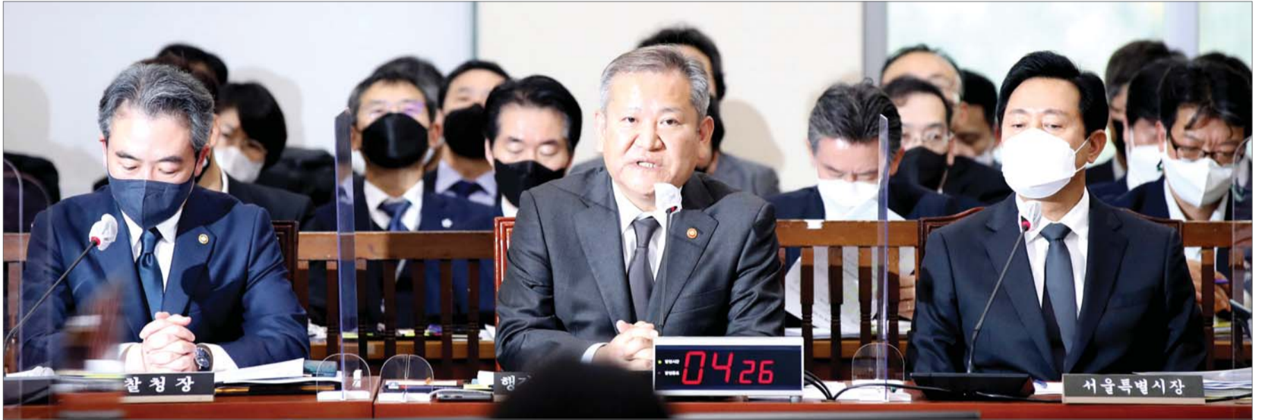
국회 행안위 전체회의

KDI는 이날 '11월 경제동향'을 통해 "최근 우리 경제는 대외 여건 악화에 따라 수출을 중심으로 성장세가 악화하는 모습"이라고 밝혔다. 주목할 부분은 3개월째 이어졌던 '경기 회복세 약화'란 표현이 이번에 '성장세 약화'로 바뀌었