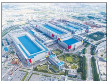
삼성전자 평택캠퍼스 전경.

삼성전자는 이번 협약으로 수원과 용인, 화성과 오산시 등 공공하수처리장 방류수를 삼성전자 기흥과 화성, 평택