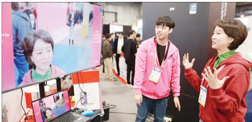
이영 중기부 장관이 지난 6일(현지시간) 미국 네바다주 라스베이거스 CES 2023 전시회에서 K-스타트업관 참여기업들을 방문해 격려하고 있다.

국내 벤처·창업기업은 2019년 당시 7개사가 수상하는데 그쳤지만 코로나19 확산으로 참여가 적었던 2021년(23개사)을 제외하고는 혁신상 수상 기업이