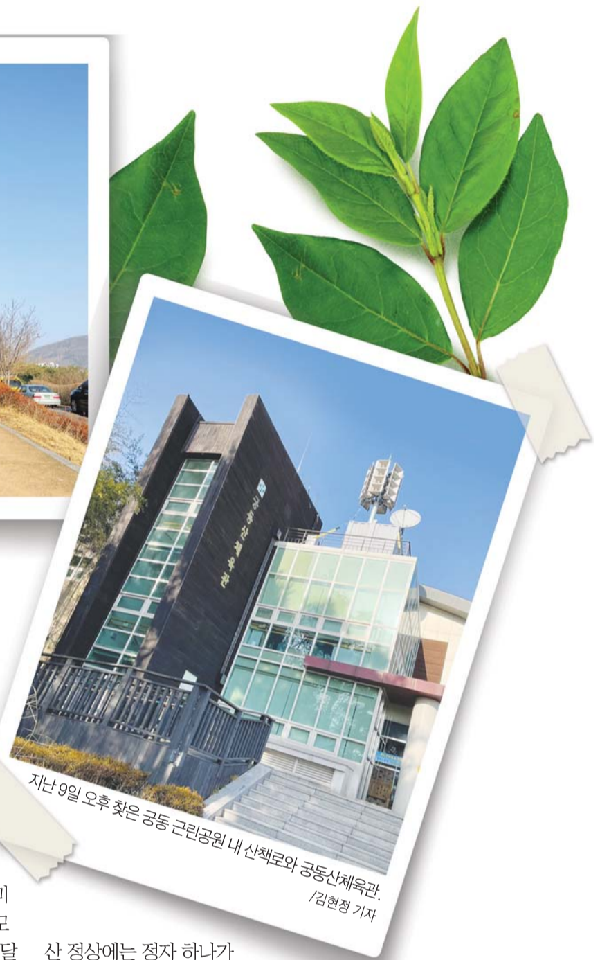
지난 9일 오후 찾은 공동 근린공원 내 산책로와 공동산체육관.

경사가 가파른 곳에는 나무 계단이 촘촘하게 설치돼서 인지 머리가 하얗게 센 노인들도 부담 없이 산을 올랐다.