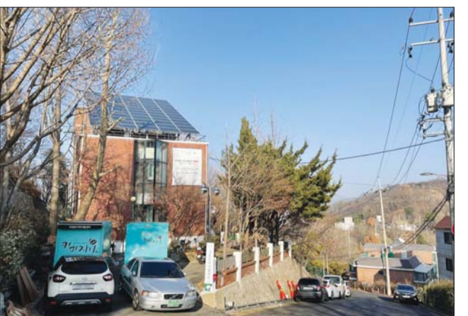
공동 근린공원 옆에 있는 서대문구 자활센터.