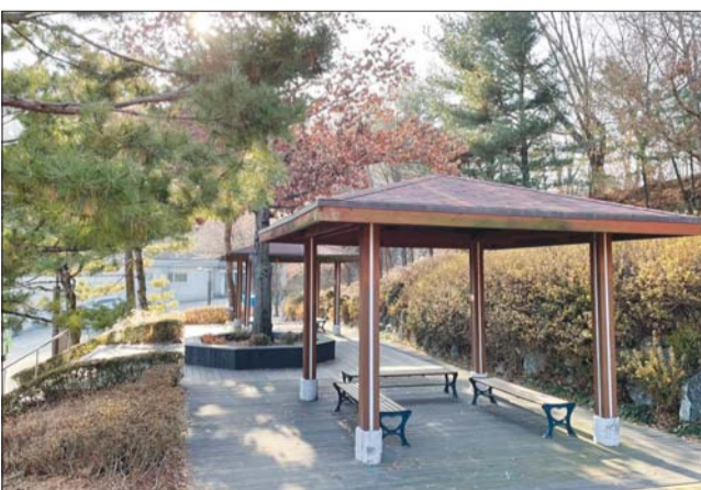
공동 근린공원에는 시민들을 위한 휴게시설이 마련돼 있다.