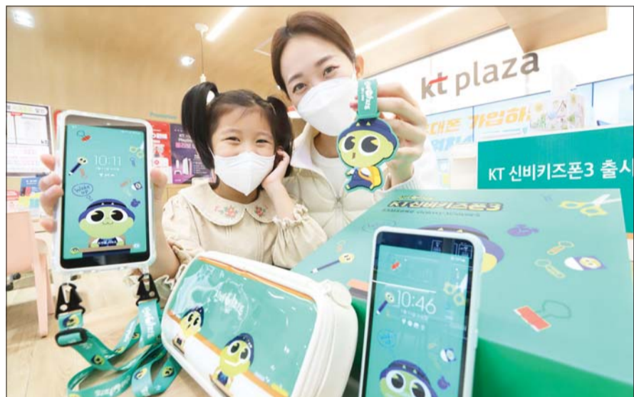
우리 아이 첫 안심폰 '신비 키즈폰3' KT가 '신비파트' 캐릭터를 적용한 LTE 기반 어린이 전용 스마트폰 'KT 신비키즈폰3'을 선보인다고 12일 밝혔다. 'KT 신비키즈폰3'은 공식 온라인몰 KT샵과 전국 오프라인 매장을 통해 13일부터 구매 가능하다.