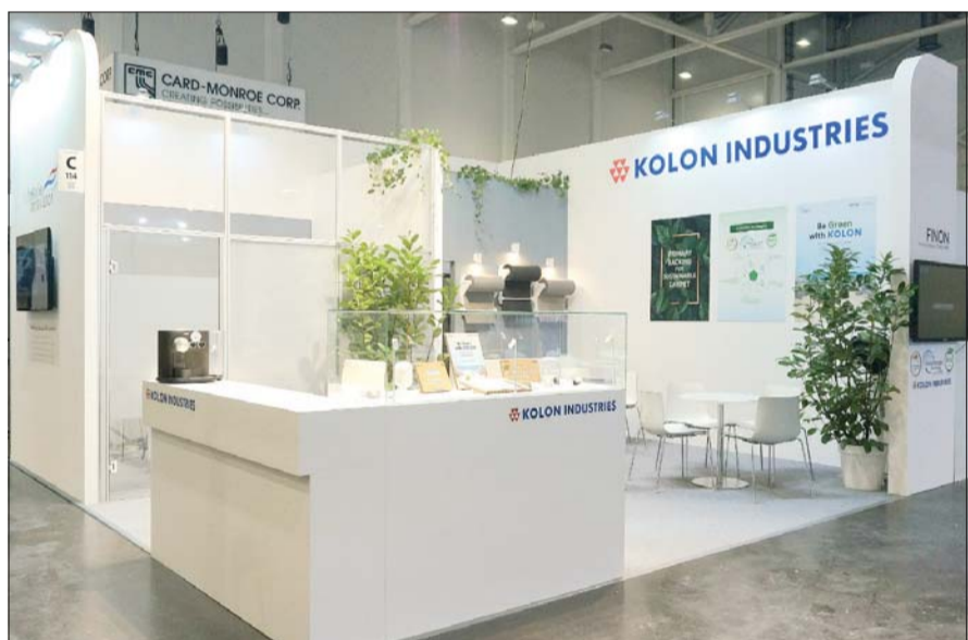
코오롱인더스트리는 도모텍스 하노버에 참가해 폴리에스터 스펀본드 등을 소개한다.

코오롱인더는 친환경 제품 특별전인 '더 그린 콜렉션'에 부직포 업체 중 유일하게 선정되기도 했다. 국내 업계 최초로 폐 페트병을 재활용해 만든 제품을 출시해 GRS 및 환경성적표지(EP