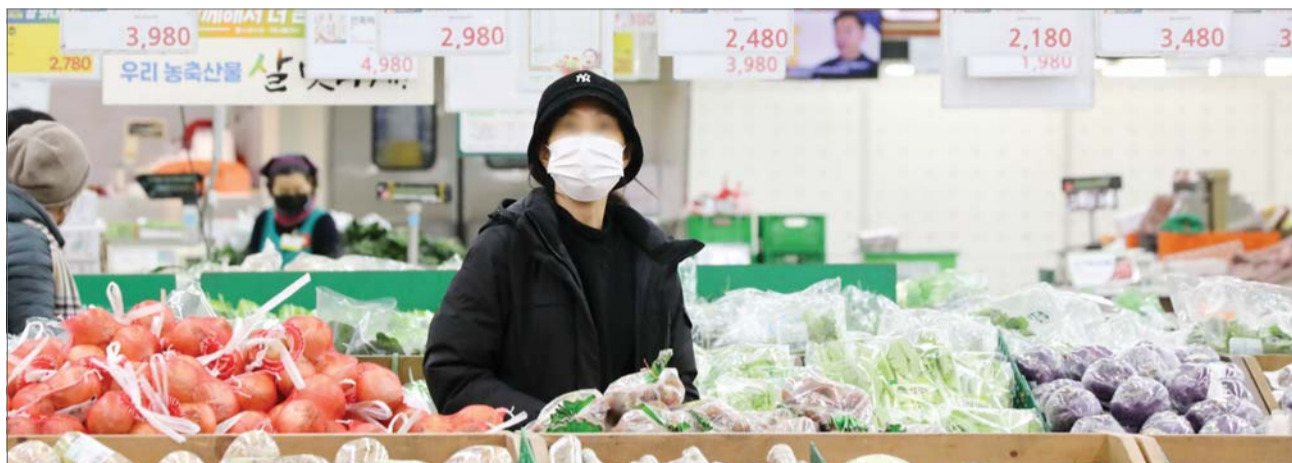
16일 서울 시내의 한 대형마트에서 한 소비자가 장을 보고 있다. 대한상공회의소가 2023년 1분기 소매유통업 경기전망지수(RBSI) 전망치를 64로 집계했다고 밝혔다. 이는 글로벌 금융위기(2009년 1분기, 73)와 코로나19 여파(2020년 2분기, 66)보다 낮은 수준이다.