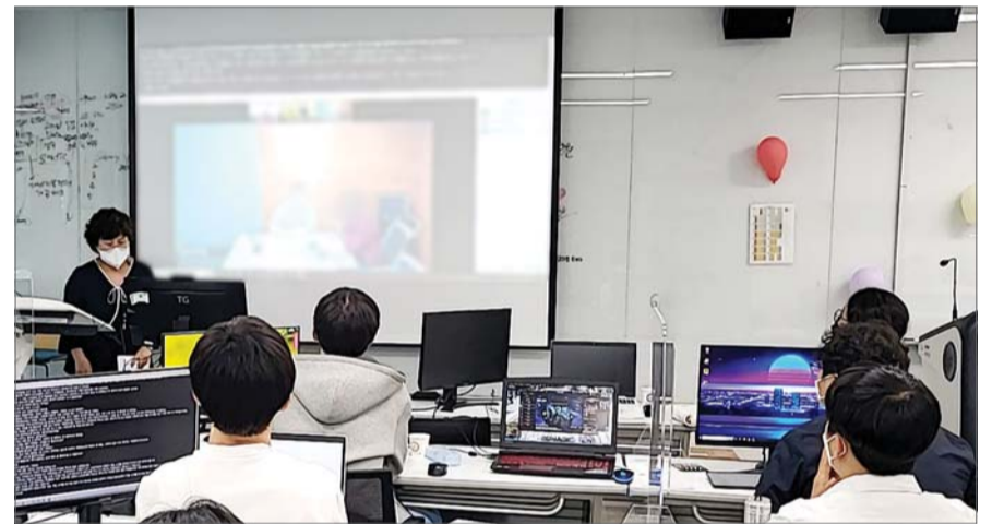
SK C&C, ‘2023 씨앗’ 교육생 모집

SK(주) C&C는 17일 기업연합 채용연계형 청년 장애인 ICT 전문가 육성 프로그램인 ‘2023 씨앗(SIAT)’ 교육생을 모집한다고 밝혔다. ‘씨앗’은 SK(주) C&C가 한국장애인고용공단 판교디지털훈련센터와 함께 운영하는 ‘청년장애인 ICT 전문가 육성·취업 지원 프로그램’이다. SK(주) C&C 씨앗 6기 교육생들이 교육을 받고 있는 모습