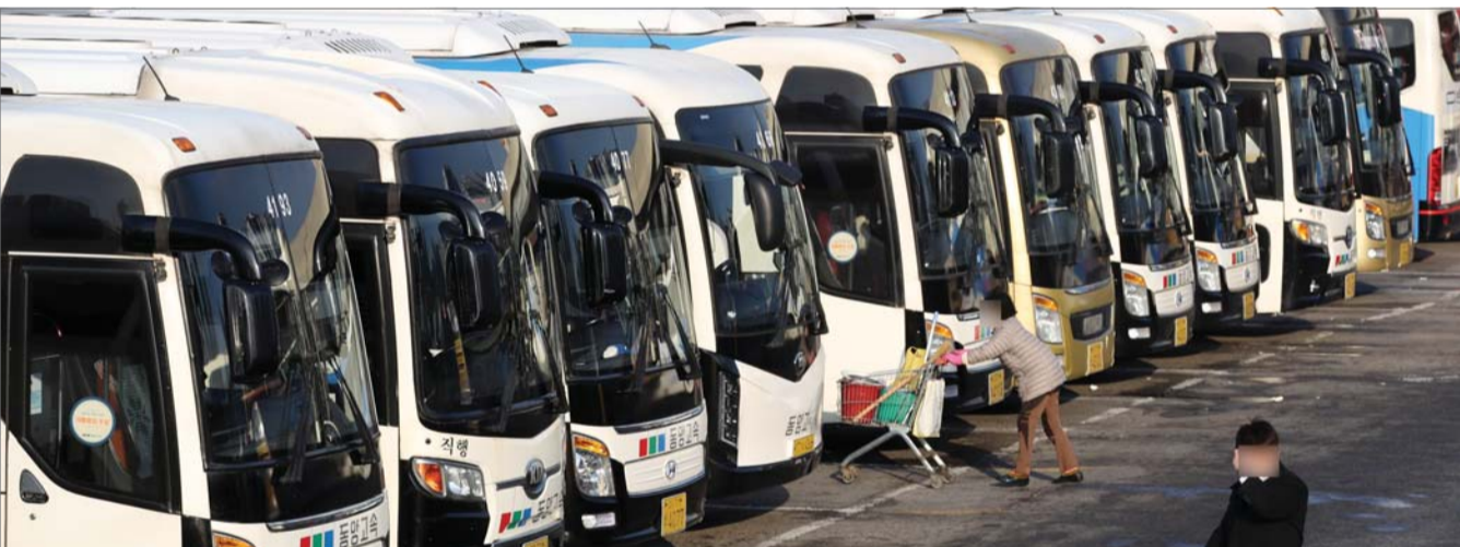
설 앞두고 버스 증차 실시

민족대명절 설을 앞두고 서울시가 연휴 3일 전인 18일부터 25일까지 고속, 시외버스 증차를 실시한다고 밝혔다. 사진은 서울고속버스터미널 모습.