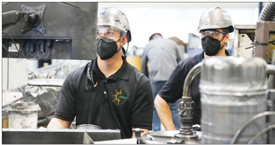
미국 애리조나주에 위치한 우르빅스의 사업장에서 직원들이 흑연 정제 과정을 살펴보고 있다.

2014년에 설립된 우르빅스는 배터리 용 친환경 천연흑연 가공 기술을 보유한