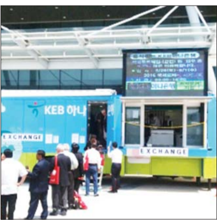
하나은행 이동형 자동화기기(ATM). 하나은행

농협은행은 오는 20일 중부고속도로 하남드림휴게소(하행선)에서 이동점포를 운영한다. 오전 9시 문을 열고 오후