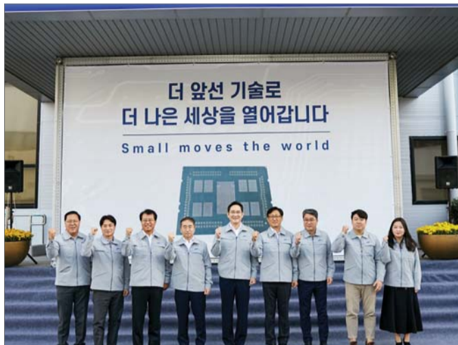
삼성전기 FCBGA 출하식에 참가한 이재용 삼성전자 회장(오른쪽 5번째)이 임직원들과 기념사진을 촬영했다.

사업별로도 주력 분야인 컴포넌트 부문이 8331억원, 광학통신솔루션 부문이