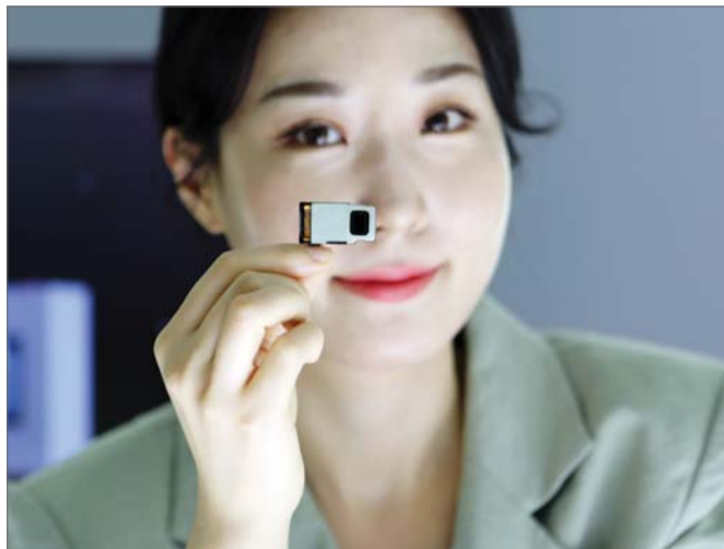
LG이노텍이 개발한 연속줌 카메라 모듈

6555억원으로 전분기보다 각각 10%, 27% 감소했다. 비수기에 모바일 시장 불황까지 겹친 탓이다.