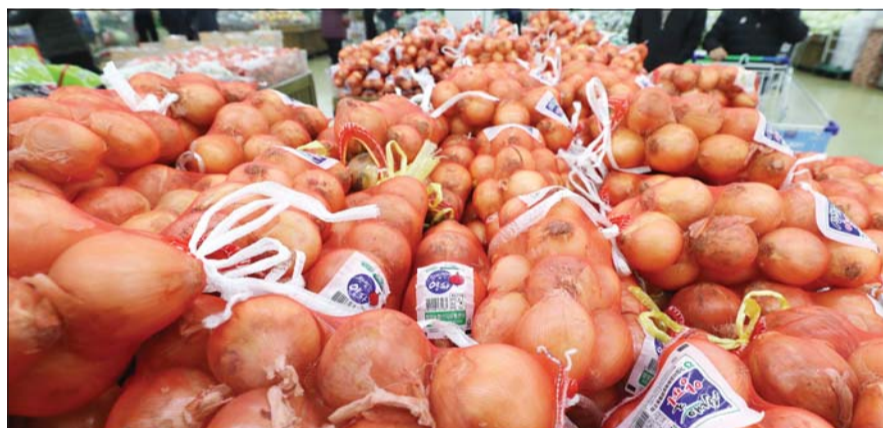
오이·양파 등 주요 채소가격 폭등

5일 서울 시내 한 대형마트에 양파가 진열돼 있다. 오이·양파·대파·애호박 등 주요 채소도 매가 가격이 난방비 상승과 학교 개학에 맞물려 재차 폭등했다.