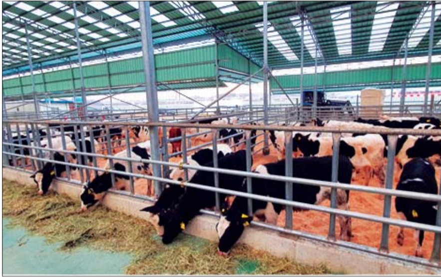
오는 22일 네팔로 운송될 예정인 젖소가 경기도 화성 소재 검역시행장 입소해 있다.

육우용 입식농가 마리당 5만원 지원 암컷 제외 수컷 송아지로 제한해 우유·육우자조금 총 1만마리 대상