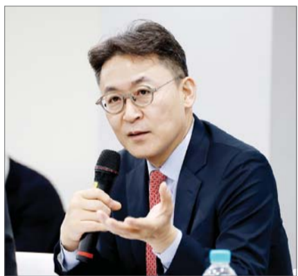
권대영 금융위원회 상임위원이 7일 서울 마포구 프론트원에서 개최된 핀테크 기업의 금융업 진입 촉진을 위한 간담회에서 건의사항을 청취했다.

이날 간담회는 핀테크기업의 금융권 진출을 확대하고 금융업의 경쟁과 혁신을 촉진시킬 수 있는 방안을 마련하기 위해 마련됐다.