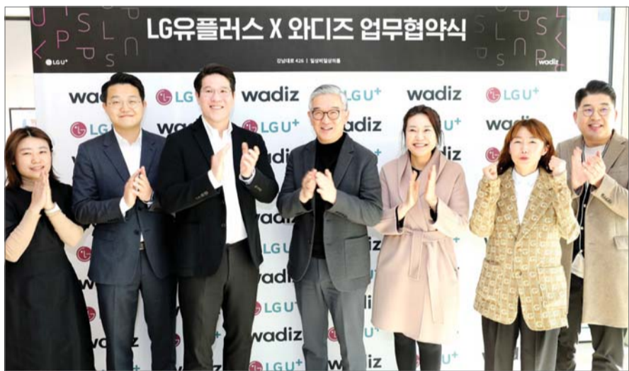
LGU+, 와디즈와 '일상비일상의틈' 펀딩제품 판매