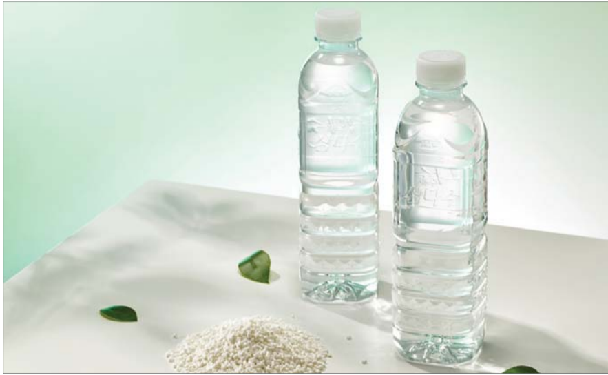
화학적 재활용 원료와 화학적 재활용 페트로 제작한 생수병

SK케미칼이 인수하는 슈에의 자산에는 폐플라스틱을 화학적으로 분해해 재활용 원료를 생산하는 해중합(Depolymerization) 공장과 여기서 생산된 'r-BHET'를 투입해 다시 페트를 만드는 'CR-PET' 생산설비가 포함됐다. 이에 따라 SK케미칼은 세계 최초로 상