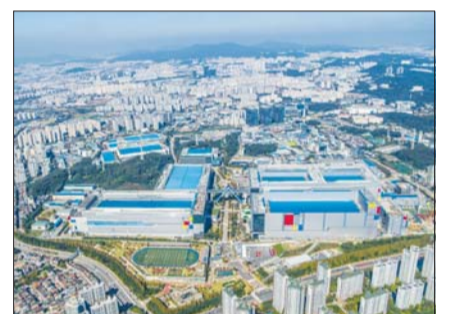
삼성전자는 화성캠퍼스가 국제수자원관리동맹(AWS)에서 최고 등급 플래티넘 인증을 획득했다고 22일 밝혔다.

AWS 에이드ريان 심 CEO는 “삼성전자 화성캠퍼스는 한국에서 처음으로 플래티넘 등급을 취득한 사례”라며 “삼