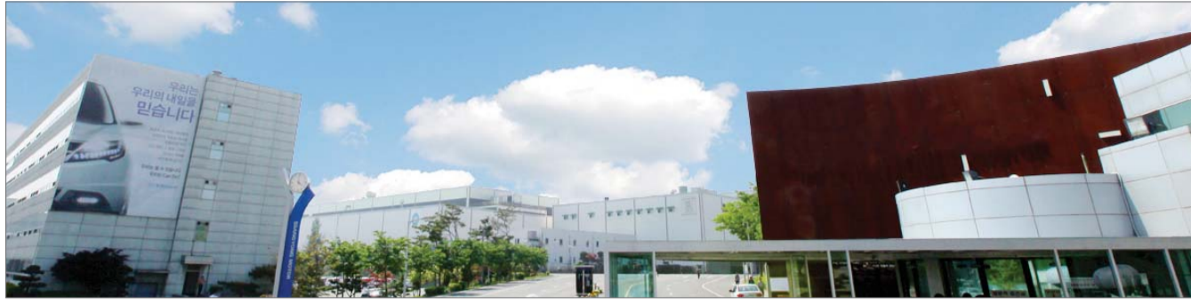
쌍용차 평택공장 전경.

기술개발·적용 등 이동서비스 집약 기업 정상화로 올해 흑자전환 목표 서울모빌리티쇼 통해 방향성 소개 인증 중고차 사업 등 신규사업 추진