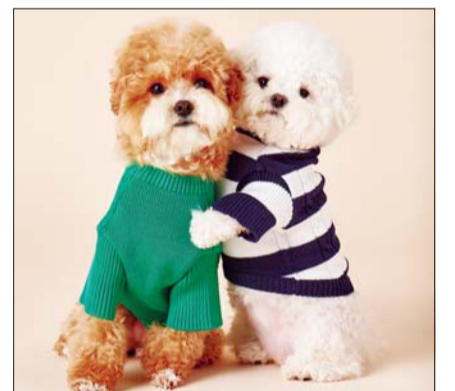
헤지스는 아이코닉 라인에 반려견 의류를 추가한다.

이번 시즌 반려견 아이코닉 라인은 피케 반팔 티셔츠와 케이블 스웨터로 구성됐다. 피케 반팔 티셔츠는 생기