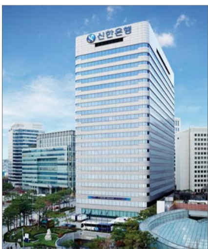
신한은행 전경

신한은행이 재건축 사업장을 대상으로 신규자금과 브릿지론 만기연장을 통해 5500억원을 지원한다고 22일 밝혔다. 최근 원자재 및 인건비 상승에 따른 공사비 증액으로 재건축 사업장의 자금 조달이 어려워지고 있는데 따른 조치다.