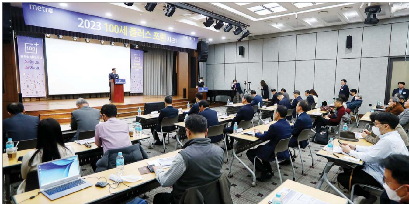
메트로신문 '100세 플러스 포럼' 성료

중국을 떠날 수도 없다. 이미 적지 않은 투자가 이뤄진 곳인데다가, 새로운 거점을 마련하기 위해서는 또다시 막대한 투자 비용과 시간을 들여야 해서다.