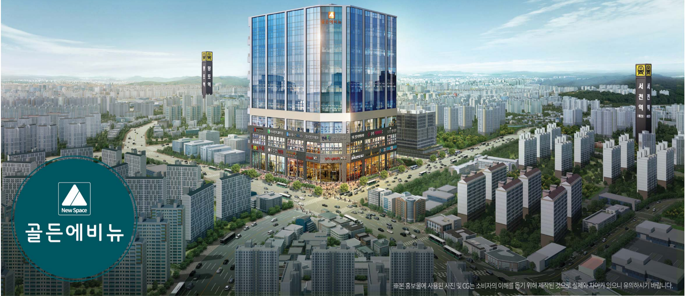
※본 홍보물에 사용된 사진 및 CG는 소비자의 이해를 돕기 위해 제작된 것으로 실제와 차이가 있으니 유의하시기 바랍니다.