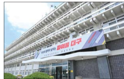
대구시 산격청사 전경 사진

회의와 법사위, 본회의 절차가 신속히 진행될 수 있도록 긴장의 끈을 놓지 않고 여야 정치권을 대상으로 마지막까지 전심전력할 예정이다.