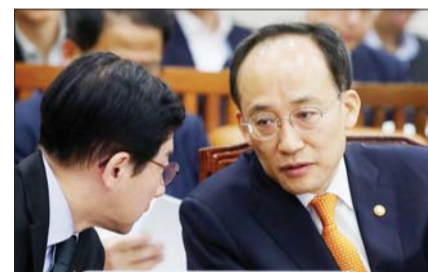
추경호 경제부총리 겸 기획재정부 장관이 22일 오전 서울 여의도 국회에서 열린 기획재정위원회 전체회의에 출석해 최상대 2차관과 대화하고 있다.