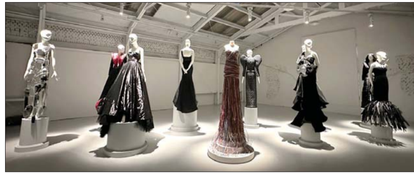
'현대 리스타일 전시'에서 공개하는 '2023 리스타일 컬렉션' 전경

현대자동차가 자동차 폐자재의 업사이클링을 통해 차별화된 패션 아이템을 선보인다. 현대차는 차량 폐자재를 패션 아이템으로 구성하는 '리스타일'(Re:Style) 프로젝트의 결과물을 소개하는 '현대 리스타일 전시'를 개최한다고 22일 밝혔다. 리스타일 프로젝트는 지속 가능성이 중요 화두로 떠오르는 가운데 자동차와 패션의 협업을 알리기 위해 기획됐다. 전시는 이날 오후 6시 오프닝 행사를 시작으로 4월9일까지 서울 성수동 AP 어게인에서 열린다. 전시는 매일 오전 11시부터 오후 7시까지 무료로 관람할 수 있다. 현대차는 세계적 패션 디자이너이자 아디다스 객원 디자이너로 유명한 제레미 스콧과 협업한 결과물인 2023 리스타일 컬렉션과 지난 3년간 컬렉션을 모은 아카이브 전시를 선보인다. 2023 컬렉션은 자동차