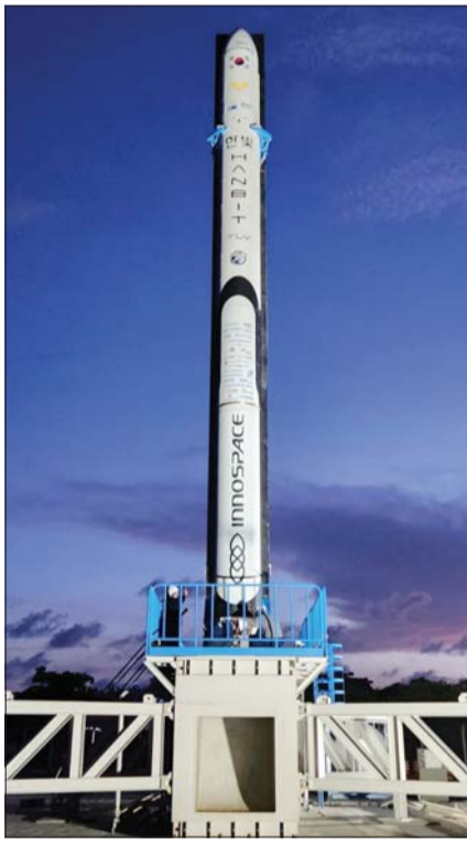
21일 발사에 성공한 국내 최초의 민간 시험발사체인 ‘한빛-TLV’가 브라질 알칸타라 우주센터에서 발사 준비를 하고 있는 모습.