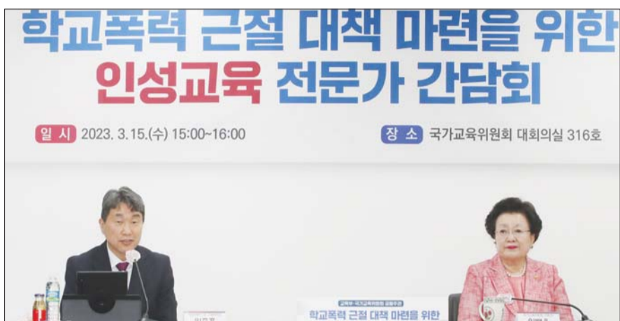
이주호 사회부총리 겸 교육부 장관이 지난 15일 서울 종로구 정부서울청사에서 열린 학교폭력 예방을 위한 인성교육 전문가 간담회에 참석해 인사말을 하고 있다.

22일 교육계에 따르면 교육부는 최근 학폭 가해 학생의 조치 사항에 대한 학교생활기록부 기록 보존 강화와 대입 반영 방안 검토 등의 내용을 담은 학폭 근절대책 추진 방향을 제시한 바 있다. 다만 김천홍 대변인은 "제기되고 있는 여러 사항들에 대해서 종합적으로 검토