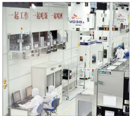
SK하이닉스 우시캠퍼스

김소영 금융위원회 부위원장이 22일 서울 중구 은행회관에서 메트로경제 주최로 열린 '2023 100세 플러스 포럼'에 참석해 인사말 하고 있다.