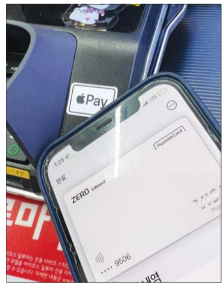
편의점 CU에서 애플페이를 사용해 물건을 구입하고 있는 모습.

애플페이 상륙 소식에 애플페이를 사용할 수 있는 가맹점을 알아보는 사람들도 많다. 현재는 대부분의 편의점과 롯데백화점, 현대백화점, 코스트코, 홈플러스 같은 백화점·마트 등에서 사용 가능하다. 스타벅스를 제외한 대부분의 커피 전문점(▲투썸플레이스 ▲빽다방 ▲이디야 ▲할리스 ▲커피빈 ▲폴바셋 등)에서도 애플페이를 사용할 수 있는 것으로 알려졌다.