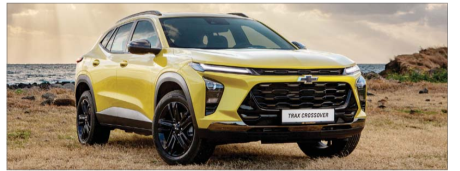
한국지엠 쉐보레 트랙스 크로스오버.