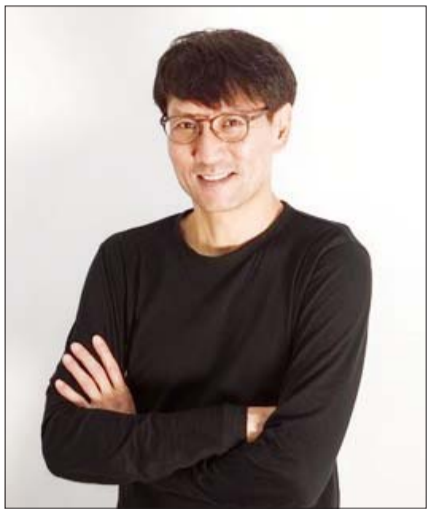
홍은택 카카오 대표.