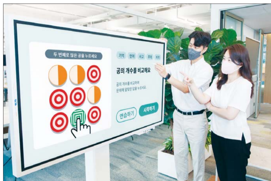
SK케미칼 구성원들이 AI기반 인지개선 프로그램 '사운드 마인드'를 시연해보고 있다.

사운드마인드는 소셜벤처 이드웨어가 개발한 인지 및 언어 훈련 프로그램으로, 자체 개발한 음성인식 및 인공지능(AI) 기술을 활용해 고령층 및 경도 인지장애 등 치매 고위험군의 치매를 예방하거나 증상 지연을 돕는 앱 서비스다.