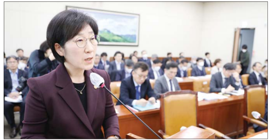
한화진 환경부장관이 21일 오전 서울 여의도 국회에서 열린 환경노동위원회 전체회의에서 법안 처리에 대한 인사말을 하고 있다.