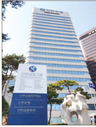
4대 금융지주 사옥 전경.

신한금융과 우리금융은 이번 주총에서 차기 회장으로 뽑힌 진옥동 내정자와 임종룡 내정자를 선임하는 안건을 표결에 부친다. 두 회장은 주총 안건이 통과하면 차기 회장으로 임기를 시작한다. NH농협금융은 올 초 지주 회장과 행장을 모두 교체했다. 이달 중 열릴 주총에