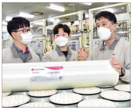
LG화학 청주공장 RO필터 생산라인에서 직원들이 테스트를 마친 수처리 필터를 살펴보고 있다.

LG화학이 중국 최대 염호 리튬 추출 프로젝트에 RO필터(Reverse Osmosis Membrane)를 공급했다.