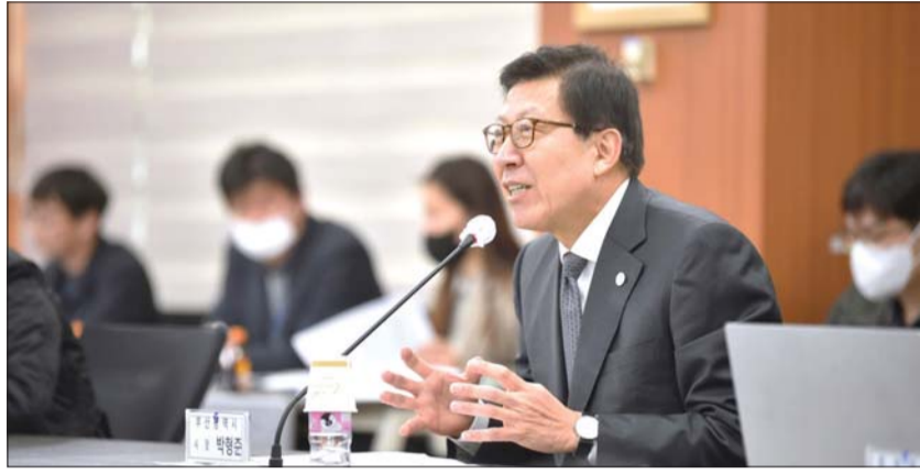
박형준 부산시장이 지난 21일 부산시청에서 열린 교육부 지역혁신 대학지원체계 간담회에서 발언하고 있다.

교육부 라이즈 사업 긍정적 평가 “중앙 바라보기식 정책 아닌 수평적 협력체계 강화 중요”