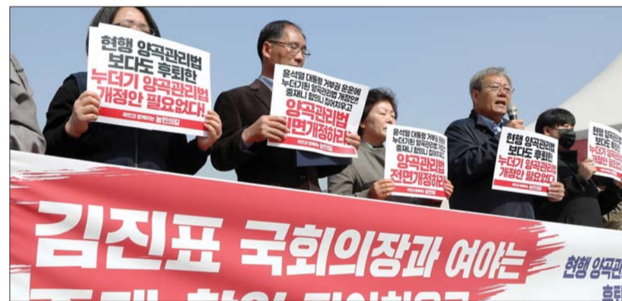
하원도 전국농민회총연맹 의장이 22일 오전 서울 여의도 국회앞에서 열린 '현행 양곡관리법보다 후퇴한 개정안' 반대 기자회견에서 발언을 하고 있다.

농림축산식품부는 ▲쌀 공급과잉 구조가 더욱 심화 및 쌀값의 지속적 하락 ▲미래 농업에 투자해야 할 막대한 재