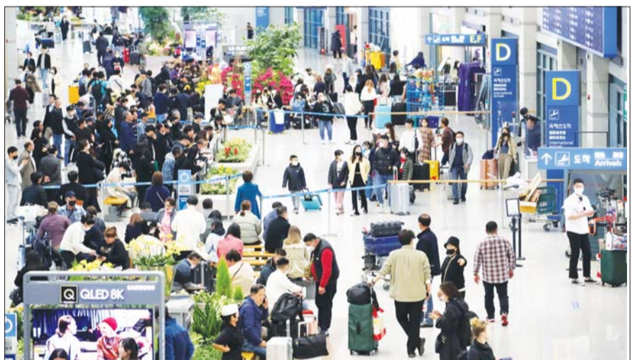
20일 인천국제공항 제1여객터미널 입국장이 이용객들로 붐비고 있다.

지난달 국내선포항여객 회복률 72% 롯데관광개발, 기항지 투어 재개 LF몰, ‘에어프리미아’ 항공권 할인 인터파크, 중국 인기 패키지 판매