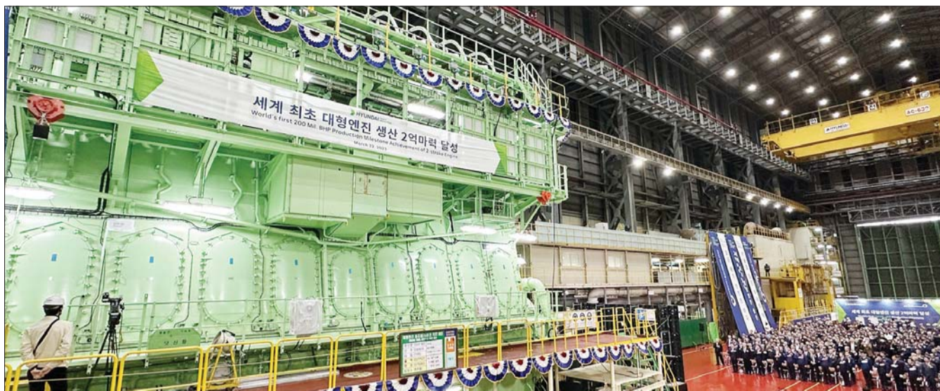
현대중공업이 22일 울산광역시 본사 엔진조립공장에서 '대형엔진 생산 2억마력 달성 기념식'을 열었다. 7만 4720 마력급 선박용 대형엔진 '8G95ME-LGIM'의 모습.

울산 본사에서 2억마력 달성 기념식 쏘나타급 중형차 125만대 출력효과 친환경 메탄올·디젤 이중연료 엔진 머스크의 1.6만톤 급 컨선에 탑재 대형엔진 세계 점유율 36% 달해