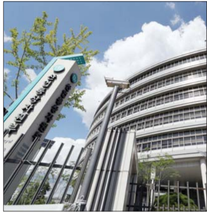
세종시 어진동 정부세종청사 산업통상자원부.

산업부, 5년간 기술개발 등 지원 인허가 패스트트랙도 적용키로 “소부장 자립화 성과 바탕으로 경쟁력 강화방안 더 촘촘히 추진”