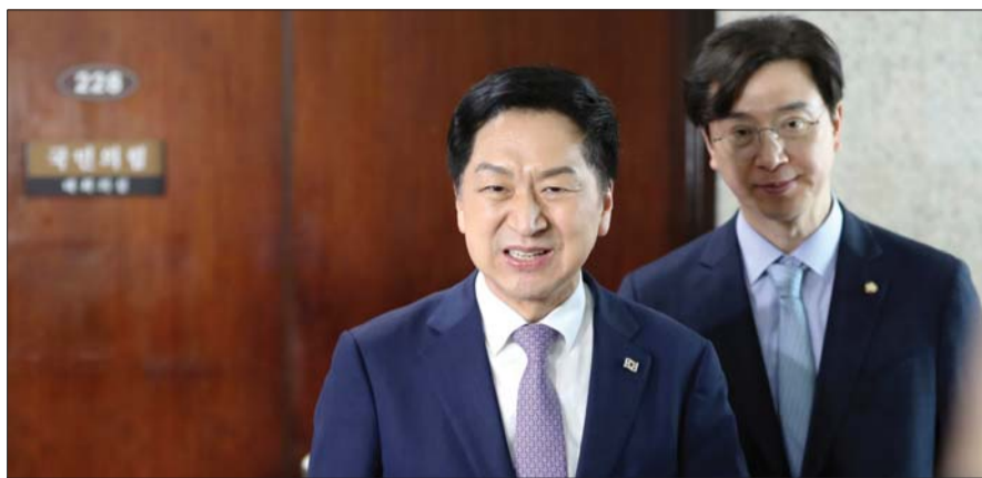
김기현 국민의힘 대표가 22일 오전 서울 여의도 국회에서 취재진의 질문 답변 뒤 이동하고 있다.

여론조사 기관 알앤씨치가 뉴스핌 의뢰로 전국 18세 이상 유권자 1014명에게 실시해 22일 발표한 국민의힘 지지율(3월 19~20일, 표본오차는 95% 신뢰수준에 ±3.1%포인트, 자세한 내용은 중앙선거여론조사심의위원회 홈페이지 참조)은 38.7%였다. 같은 조사에서 더