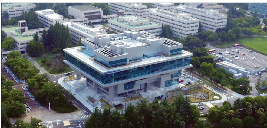
포스코가 스타트업을 발굴하고 육성하기 위해 체인지업그라운드를 개관했다