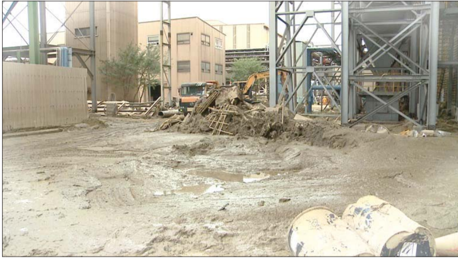
포항제철소 스테인리스 2제강공장 주변도로 복구 전(좌) 후(우) 모습.

또 제강 공정에서는 만들어진 쇳물을 연주 공정을 거쳐 슬라브로 만들기까지