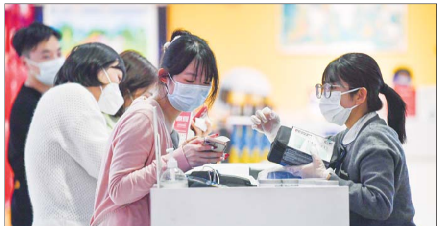
중국 하이난성 하이커우에서 고객들이 물건을 사고 있다.