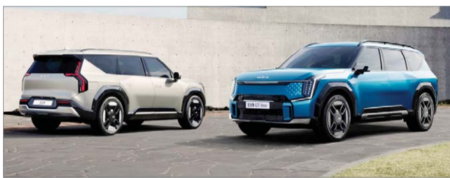
기아 EV9 & EV9 GT-line.

"EV9은 가장 혁신적인 차량으로 글로벌 시장에서 오랜기간 회자되는 차량이 될 것이다." (기아 송호성 사장) 기아가 올해 플래그십 전기차를 출시하는 등 라인업 확대를 통한 글로벌 시장 공략에 속도를 높인다.