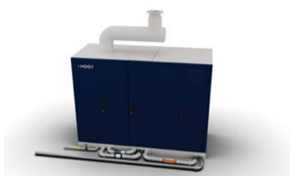
SK이노베이션과 고려아연이 투자한 '아모지'의 암모니아 기반 수소 연료전지 시스템.

롯데케미칼-美 기업과 사업 모색 SK이노-아모지에 650억 투자 등 기업들 생태계 구축 위해 손잡아