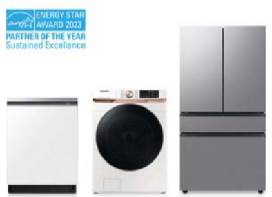
에너지스타 인증을 받은 삼성전자 주요 제품과 수상 로고

에너지 스타상은 제조와 에너지 관리, 소매 등 8개 부문에서 에너지 스타 인증 활용을 기준으로 성과가 있는 단체에 시상한다. 최고상인 '지속가능 최우수상'은 본상인 '올해의 파트너'로 2회 이상 선정된 곳 중 성과가 탁월한 기업과 단체를 대상으로 한다. 2만여개 기업과 단체