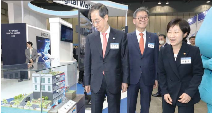
한덕수 국무총리와 한화진 환경부 장관이 22일 경기 고양시 킨텍스 제2전시장에서 열린 세계물의 날 기념식을 마친후 제20회 국제물산업박람회(Water Korea 2023)를 찾아 전시부스를 둘러보고 있다.

국제물산업박람회는 지난 2002년 시작, 올해 20회를 맞는 국내 최대 규모의 물산업 전문 전시회다. 이번 박람회에는 미국 워터리아와 중국 베이징 월신 그린 테크놀로지 등 10개국 바이어(Buyer) 18개사가 참여했다.