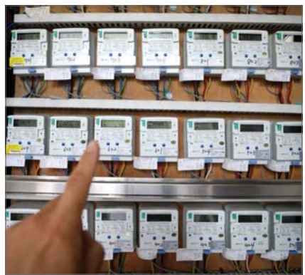
서울 시내 한 오피스텔에 전기계량기가 돌아 가고 있는 모습.

2분기 전기료 이르면 내주 결정 원가이하 요금에 재무악화 심화 kWh당 10원 안팎 인상 가능성