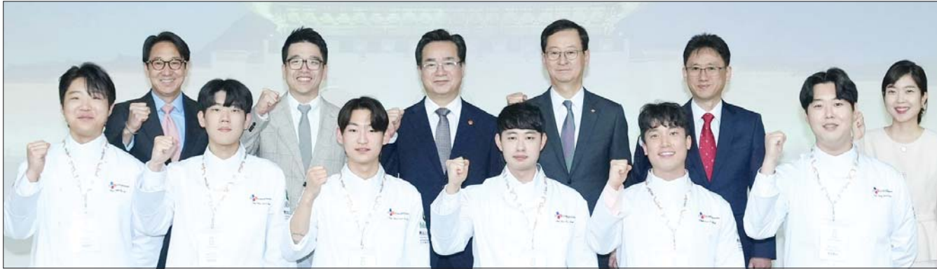
2일 서울 필동 CJ인재원에서 열린 Cuisine. K 발족식에서 CJ제일제당 주요 경영진, 농림축산식품부 장관 및 관계자, 국가대표조리팀 대표 선수들이 함께 기념사진을 촬영하고 있다

퀴진케이 프로젝트는 ▲국제요리대회 출전 국가대표팀 후원 ▲한식 팝업 레스토랑 운영 ▲해외 유명 요리학교 유학 지원 및 한식 교육 과정 개설 ▲한