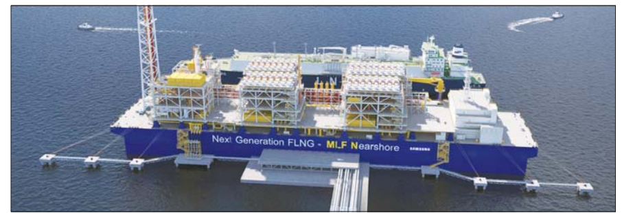
삼성중공업의 차세대 FLNG 독자모델인 MLF-N의 모습.

삼성중공업의 MLF-N은 선형과 사양을 표준화한 것이 특징이다. LNG 화물창 형상과 이를 둘러싼 선체를 규격화