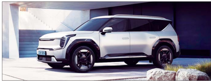
더 기아 EV9 기본모델.