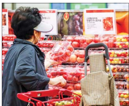
2일 서울 시내 한 대형마트에서 시민들이 장을 보고 있다.

수)는 4.6% 올라 전월 4.8%보다 상승폭을 소폭 줄였다. 경제협력개발기구(OECD) 기준 근원물가인 식료품 및 에너지 제외 지수는 전년보다 4.0% 올랐다. 구입빈도와 지출 비중이 높은 품목 위주로 구성된 생활물가지수는 전년보다 3.7% 상승했다.