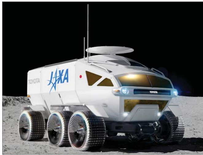
도요타 달 탐사선 루나 크루저 상상도

글로벌 완성차 기업들이 지상은 물론 하늘길과 우주까지 사업 영역을 무한대로 확대하고 있다.