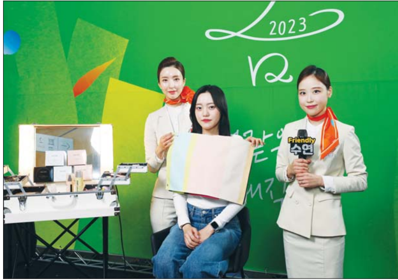
경기도 성남시 AK플라자 분당점에서 진행된 '제주항공 봄여행 메이크업쇼'에서 제주항공 객실승무원들이 시민들을 대상으로 메이크업을 시연했다.

실제로 색조화장품을 구매하는 고객들이 급증하고 있다. 2일 롯데백화점에 따르면 올해(1월 1일~4월 25일) 뷰티 상품군 매출은 전년 동기 대비 20% 신장하며 코로나 이전(2019년)보다도 5% 증가한 성장세를 보이고 있다. 롯데백화점은 가정의 달인 5월 한 달간 뷰티