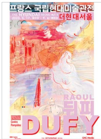
더현대 서울은 9월까지 프랑스 거장 라울 뒤편의 작품 130여 점을 전시한다.

'기쁨의 화가'로 불리는 라울 뒤편(1877~1953)은 20세기를 대표하는 미술 거장으로 손꼽히며, 회화, 일러스트레이션, 패션 등 다양한 분야에서 활약했다. 화려한 빛과 색으로 삶이 주는 행복과 기쁨을 주제로 수많은 작품을 탄생시켰다.