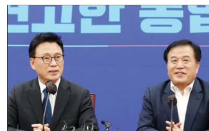
박광온 더불어민주당 원내대표가 2일 오후 서울 여의도 국회에서 이진복 대통령실 정무수석과 대화를 하고 있다.

자들과 만나 “이 정무수석이 ‘대통령은 여야 원내대표와 만날 의향이 있다. 둘이 합의하면 만날 수 있고 여야 원내대표가 따로 만나는 과정에서 본인을 부르면 본인이 올 수도 있다’고 이야기했다”고 말했다.