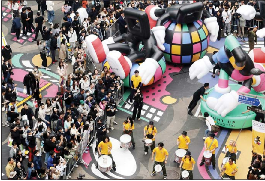
지난달 30일 서울 중구 명동거리에서 열린 '명동 페스티벌 2023'에서 개막 세리머니로 페스티벌 캐릭터인 '미응이'와 라퍼커션의 퍼레이드가 진행되고 있다. 서울시와 롯데백화점은 오는 5월 7일까지 내·외국인 관광객 유입과 명동 상권 활성화를 위한 페스티벌을 진행한다.

유통기업들이 상권 전체를 띄우는 대형 축제를 열고 있다. 1개 점포 단독 행사가 아닌 상권 전반과 규합해 즐길 거리를 더욱 넓혔다.