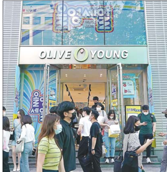
올리브영 강남 타운 매장 앞이 쇼핑객들로 붐비는 모습.

를 찾는 이도 늘었다. 실제로 지난해 마스크 착용 규정이 완화되면서 피부과 이용액이 크게 늘었다.