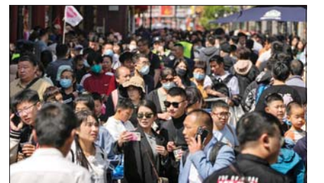
지난 1일 중국 베이징의 천안문 광장에 많은 방문객들이 몰렸다.

여행이나 소비 등 일부 부문별로는 코로나19 확산 이전인 2019년 수준을 넘어서면서 경기 회복에 대한 기대감은