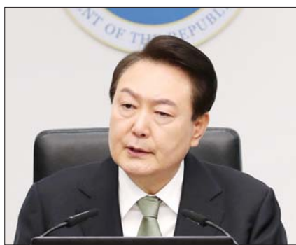
윤석열 대통령이 2일 오전 서울 용산 대통령실 청사에서 열린 국무회의를 주재하고 있다.

력이 확대되고 상호 시너지를 발휘하면서 ‘미래로 전진하는 행동하는 한미동맹’이 구현될 것”이라고 부연했다.