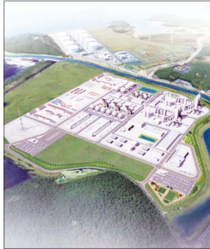
‘보령 블루수소 생산기지’ 예상 조감도.

양사의 이번 투자금은 국내에 건설되는 ‘수소기술 R&D센터 및 기가팩토리’ 구축에 투입된다. 기가팩토리는 차