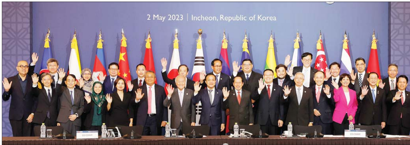
추경호 경제부총리와 이창용 한국은행 총재를 비롯해 한·중·일 및 동남아시아국가연합(아세안) 재무장관과 중앙은행 총재들이 2일 오후 인천시 연수구 웨라톤 그랜드 인천 호텔에서 열린 '26회 아세안+3(한·중·일) 재무장관·중앙은행 총재 회의'에서 기념 촬영을 하고 있다.

상회담 이후 수출 규제 정상화 등 양국 간 분위기 변화가 감지되는 점은 매우 고무적"이라며 "앞으로 일본 측 화이트리스트 복원이 조속히 완료되길 희망한다"고 말했다. 앞서 우리나라는 일본 수출규제를 풀었으나 일본은 우리나라를 화이트리스트 대상국으로 재지정하는 절차를 진행하고 있다.