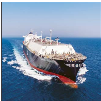
HD현대중공업이 건조해 2022년 인도한 20만입방미터(㎥)급 LNG운반선의 시운전 모습.

특히 17만4000㎥급 LNG운반선에는 모두 HD한국조선해양이 자체 개발한 Hi-ERSN(LNG재액화시스템)과 Hi-