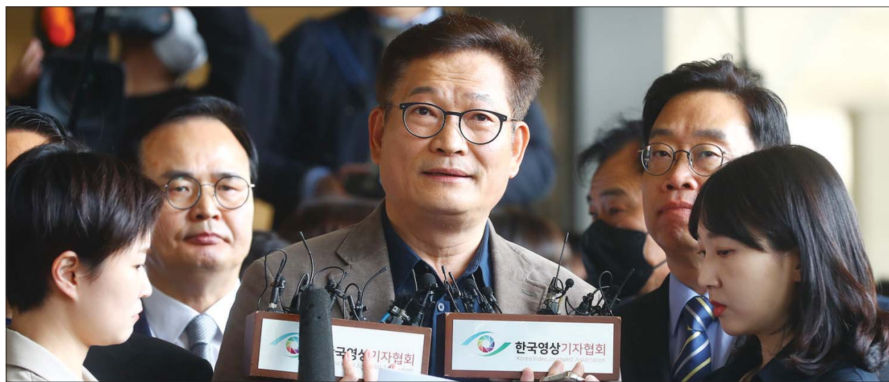
더불어민주당 전당대회 돈 봉투 살포 의혹의 핵심 인물인 송영길 전 민주당 대표가 2일 서울 서초구 서울중앙지검에 자진 출석했으나 출입 거부 당한 뒤 입장을 밝히고 있다.

이후 송 전 대표는 취재진 앞에서 기자회견문을 읽으며 “검찰의 수사 대상이 된다는 것은 정말 고통스러운 일이다. 그러나 범죄혐의가 있다면 당연히 수사를 받아야 한다”면서도 “증거에 기초한 수사를 해야지, 사람들을 마구잡이로 불러서 별건수사로 협박하고 억박질러 진술을 강요하는 전근대적인 수사는 안 된다”고 강조