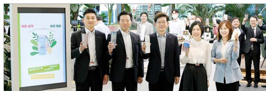
'ESG 실천하는 날' 캠페인에 참여한 빈대인 BNK금융그룹 회장(가운데)이 임직원들과 포즈를 취했다. /BNK금융

캠페인에 동참하는 임직원에게는 커피 등 각종 음료를 무료로 제공할 예정이다. 참여 확산을 위해 월별 캠페인