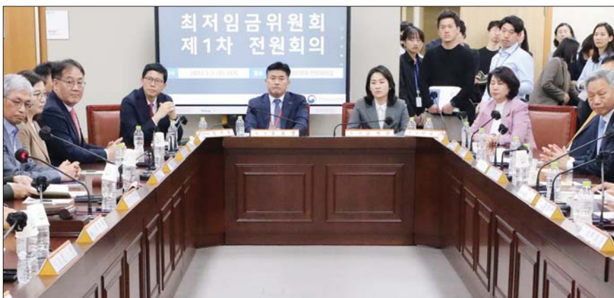
내년 최저임금을 결정할 최저임금위원회의 첫 회의가 2일 오후 세종시 정부세종청사에서 열리고 있다.

회는 노사공이 동수 참여하는 의사결정 기구로 독립성 보장을 위해 임기와 위촉, 해촉 절차를 법령에 규정하고 있다”면서 “남은 임기동안 공익위원의 한 사람으로서, 간사로서 책무를 성실히 수행할 것”이라며 사퇴 요구를 일축했다.