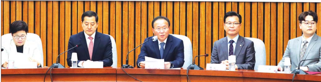
윤재욱 국민의힘 원내대표가 2일 오전 서울 여의도 국회에서 열린 노동개혁특별위원회 임명장 수여식 및 1차 회의에서 발언하고 있다.

일시 : 2023. 5. 2.(화) 10:30, 장소 : 국회 본관 245호