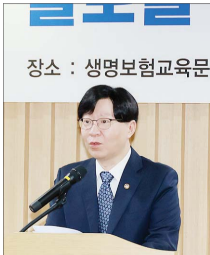
김소영 금융위원회 부위원장이 3일 오전 서울 종로구 센터포인트광화문빌딩에서 개최한 보험산업 글로벌 경쟁력 강화 세미나에 참석해 개회사를 하고 있다.

지난 2021년 기준 우리나라 국내총생산(GDP) 대비 보험료가 10.9%로 전