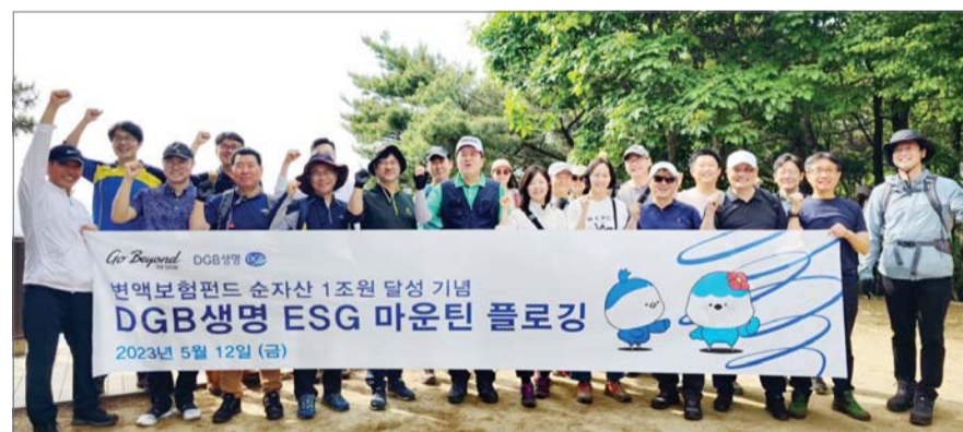
DGB생명 임직원들이 12일 서울 청계산에서 ESG 마운틴 플로깅 행사를 진행한 뒤 기념촬영을 하고 있다.