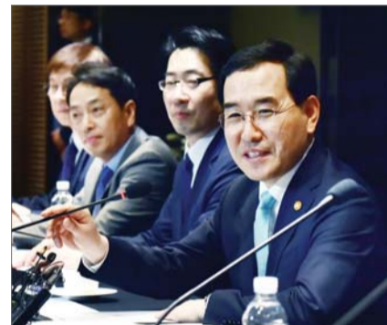
이창양 산업통상자원부 장관이 18일 서울 중구 남대문로 코트야드 메리어트 남대문에서 열린 무기발광산업 육성 얼라이언스 출범식 및 디스플레이산업 혁신전략 원탁회의에서 발언하고 있다.

조세특례제한법 상 국가전략기술로 5개의 디스플레이 핵심기술을 지정해 기업의 투자부담을 대폭 낮추고, 산업은행이나 신용보증기금 등 주요 금융기관은 신규 패널시설 투자, 디스플레이 장비 제작자금 등에 약 9000억원의