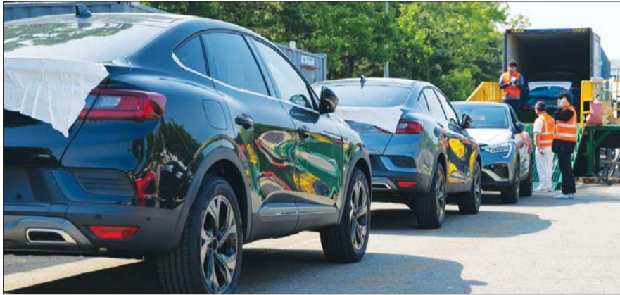
컨테이너에 실리는 아르카나. 3대를 지그재그로 싣는 방법으로 활용을 극대화했다.

르노코리아는 최근 여러 악재를 겪었다. 신차 부재로 국내뿐 아니라 해외 판매도 주춤했었던 아니라, 노사간 잡음까지 겪었다. 공장을 계속 유지할 수 있을지에 대한 우려까지 나왔다. 그나마