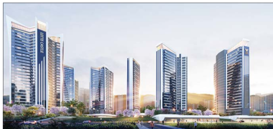
‘청량리 제8구역 주택재개발정비사업’ 투시도.