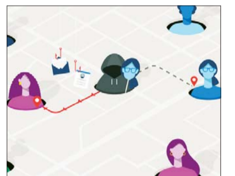
마이크로소프트, 비즈니스 이메일 침해 관련 사이버 범죄 활동 급증.